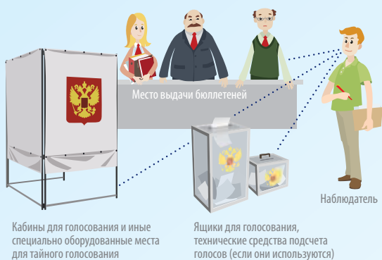
Кабины для голосования и иные специально оборудованные места для тайного голосования